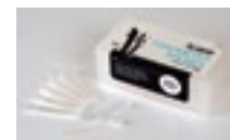
Fundas Tonovet HQ131