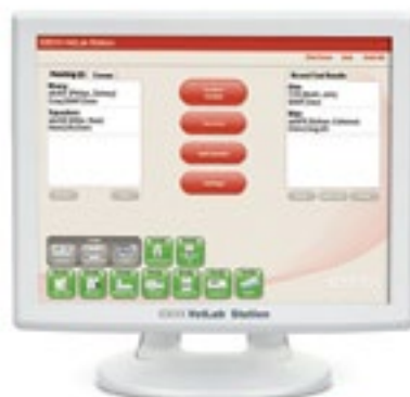
IDEXX Vetlab® Station